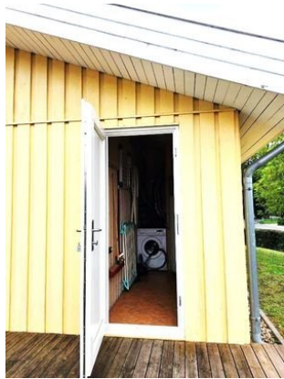
Tür HA Raum