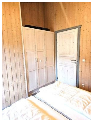
Schrank im Schlafzimmer