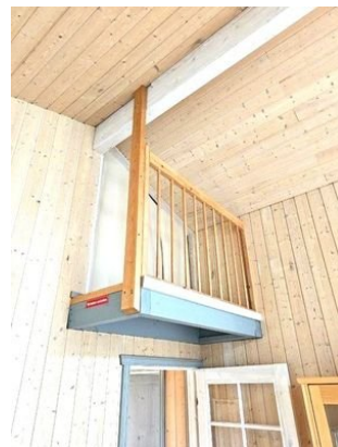
Nische im Wohnzimmer