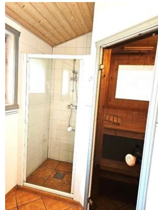
Dusche im Bad