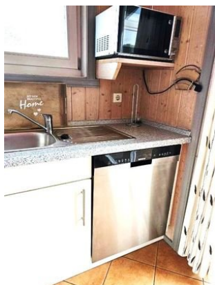
Geschirrspüler in Küche