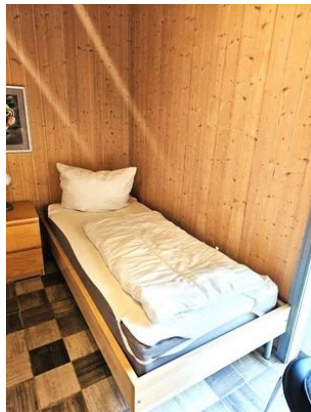
Bett im Kinderzimmer