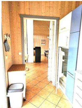
von der Küche zum Wohnzimmer