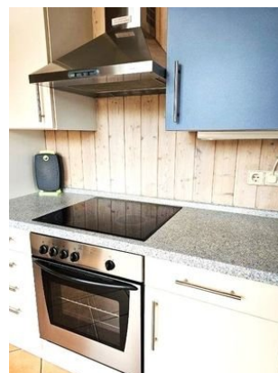
Herd in Küche